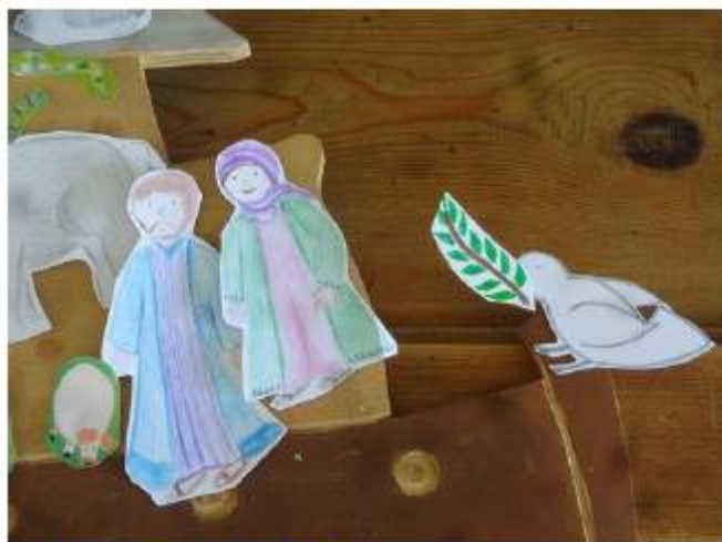
Eveil à la foi