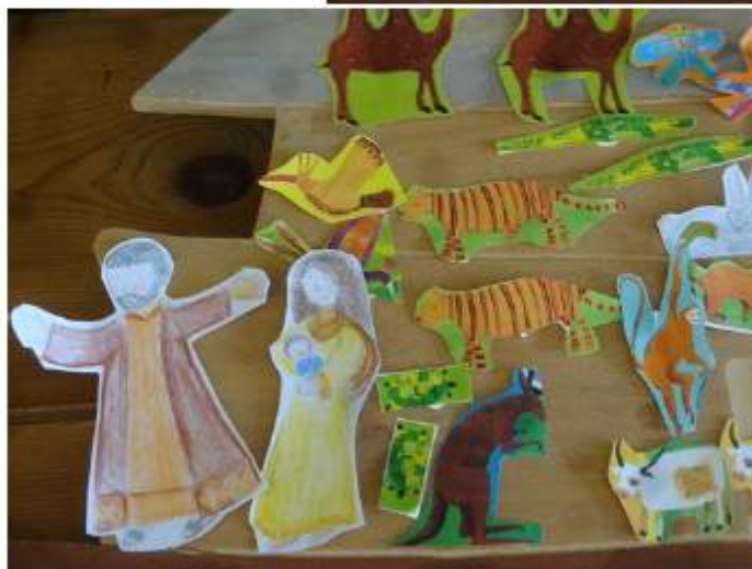
L'arche de Noé